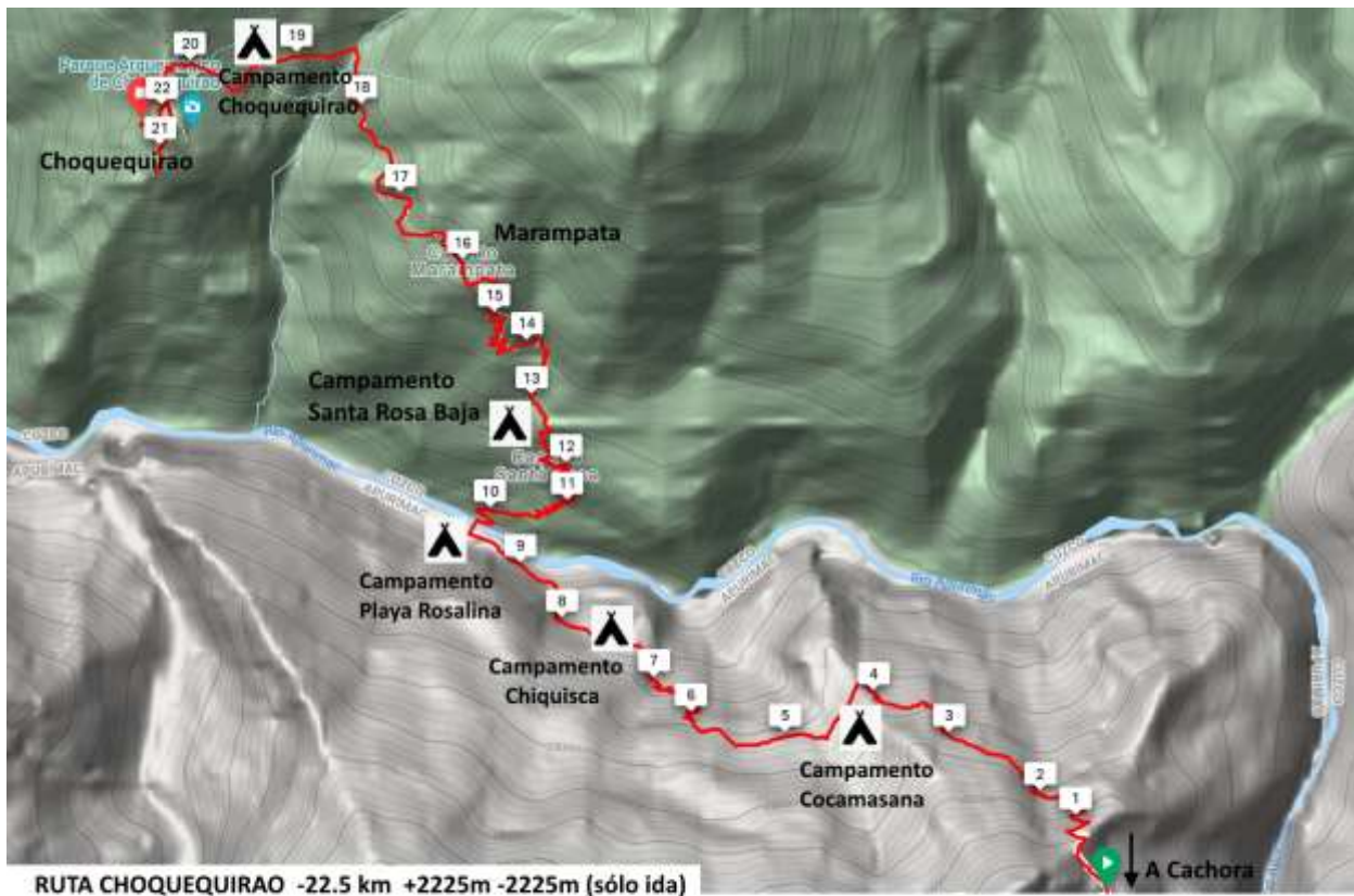
RUTA CHOQUEQUIRAO -22.5 km +2225m -2225m (sólo ida)