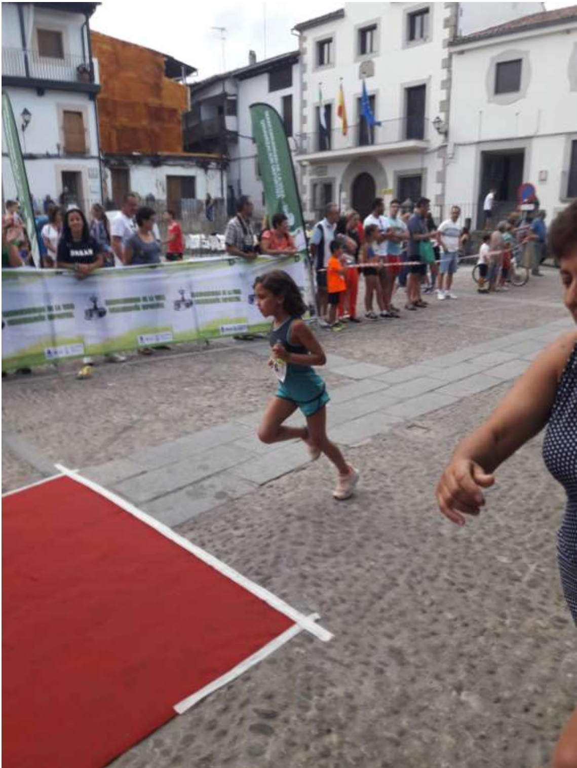
así que el momento de competir en la montaña era fácil que llegase.