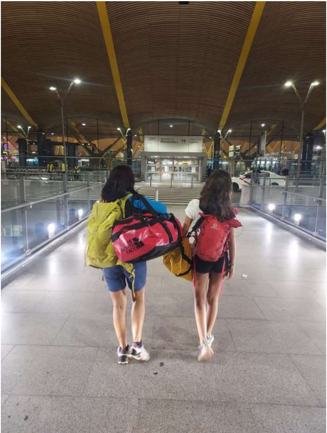
con la Escuela Junior del Club. 01- 05 septiembre 2023.