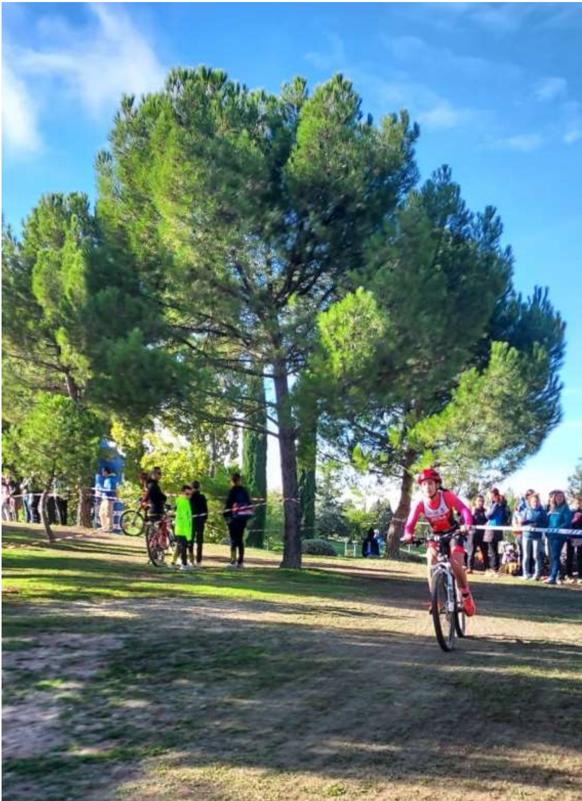
Segmento de bici

Todo este recorrido me ha ayudado a disfrutar y sacar lo mejor de mí como persona y deportista.