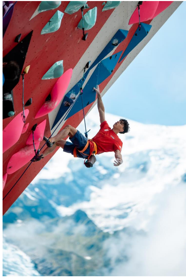
Copa del Mundo de dificultad 2024