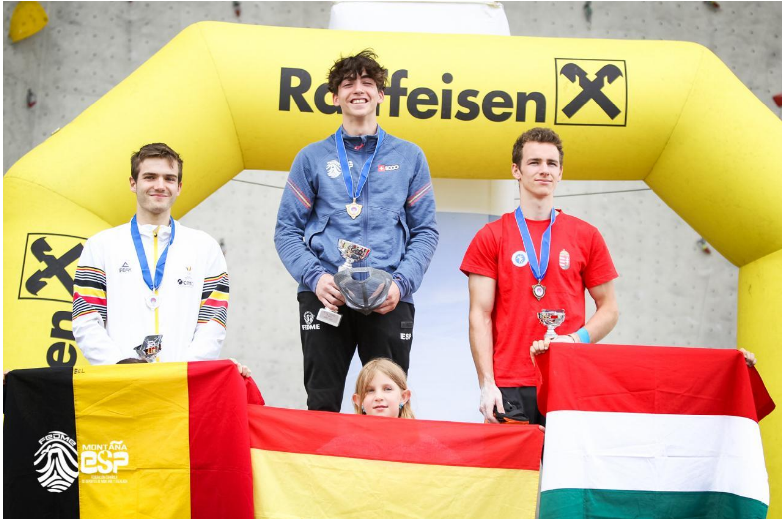
Podium Copa de Europa de dificultad 2024

Los resultados obtenidos en la copa de Europa de dificultad en categoria absoluta fueron magnificos, obteniendo la victoria total despues de ganar 2 de las tres pruebas puntuables, en concreto la de Bolonia (Italia) y la de Augsburg (Alemania).