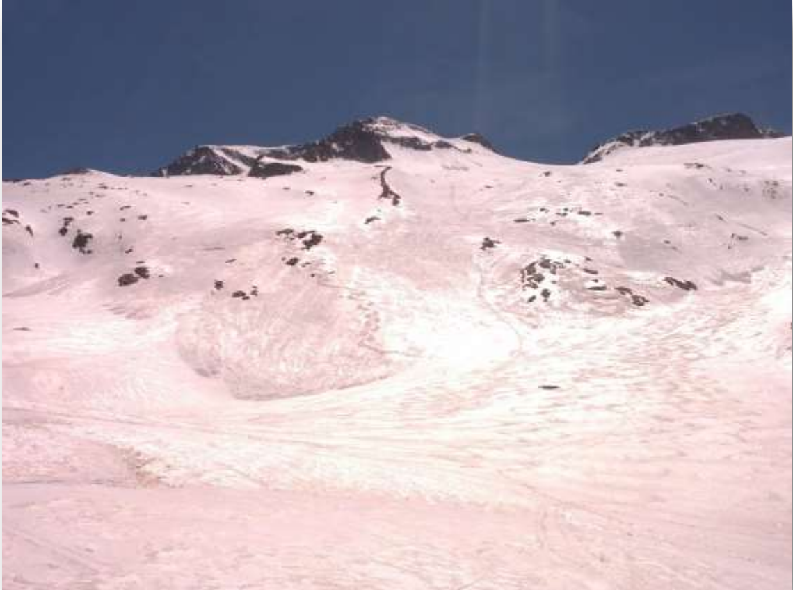
Mis giros, justo bajo la cumbre del Aneto. En el tramo final del glaciar.

De nuevo en la rimaya, calzo los esquíes y por el Portillón Superior me encamino al mítico glaciar del Aneto. A los 3200 m aproximadamente, tengo de nuevo que ponerme los crampones para afrontar el tramo final de la subida al monarca del Pirineo. Tras pasar con mucha precaución el paso de Mahoma, consigo llegar a la cumbre (3404 m), donde sólo coincido con una pareja que me hacen el favor de sacarme una foto. Descendiendo por su glaciar, dejando mis giros en la nieve primavera de las cotas más bajas, hasta Aigüalluts y vuelta al refugio por el Collado de La Renclusa.