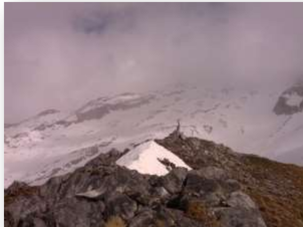
La Maladeta al fondo, entre las nubes, desde la cumbre del Pico Paderna

Viaje hasta Benasque, concretamente hasta La Besurta. Subida hasta el refugio con todo el material necesario para pasar estos tres días. Y ascenso al Pico de Paderna (2622m) por el Ibón de La Renclusa; con un tiempo aún revuelto, nevando a ratos. Y descenso a cenar al refugio.