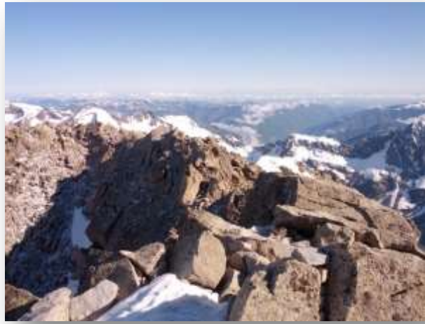
Desde la cumbre del Pico del Alba, vistazo a la cresta de acceso.

Tras calzar los esquís, me dirigí hacia el Pico de La Maladeta (3308 m) atravesando su glaciar, bordeando los Picos Mir, Sayó y Cordier. Dejé los esquís en la rimaya y afronté el corredor hacia el collado de la rimaya, abriendo huella en la nieve caída los días anteriores. Una capa de unos 15 cm, sobre una nieve muy helada en la que los crampones ligeros les costaba agarrar.