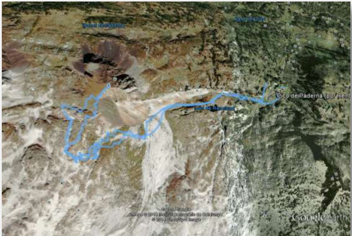
Track del ascenso al Pico de Paderna. Día 13 de Mayo.