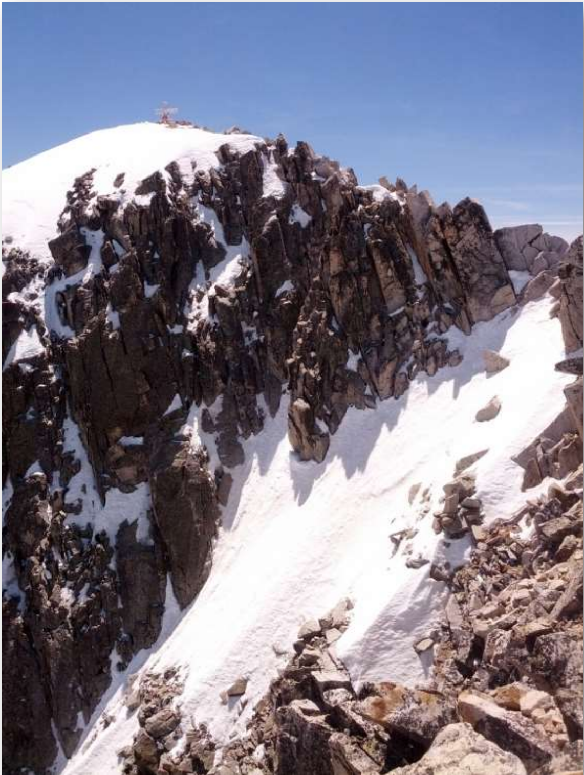
El archiconocido Paso de Mahoma