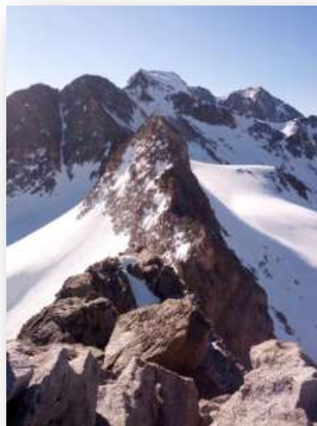
La Maladeta, desde la cumbre del Pico del Alba