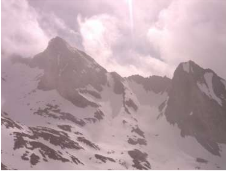
Tuca y Tuqueta Blanca de Paderna