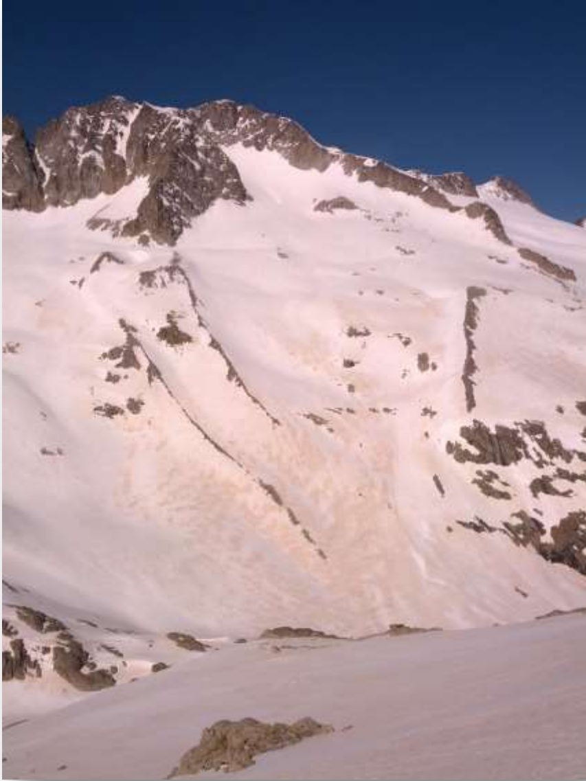
Vista de Aneto, en el descenso al Valle de Barrancs.

Al día siguiente bajé a Huesca a buscar a mi mujer. Para así el día 17 hacer una excursión juntos hasta la Rimaya de La Maladeta. Con una esquiada de bajada a La Besurta fabulosa.