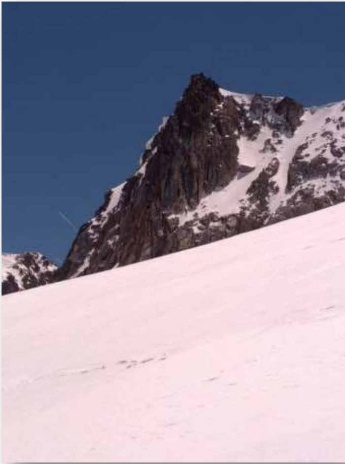
El Pico de Coronas, por el collado entre este y el pico del Medio, accedí a su cumbre.

del Aneto, únicamente vi a unas personas al final de Aigüalluts. Por lo que volví a gozar de la soledad más extrema y el silencio absoluto de estos valles pirenaicos. Siendo el descenso al valle de Barrancs, uno de los más bellos que haya hecho jamás, con el Aneto en frente de mi y sus morrenas indicando otros tiempos de mayor esplendor.