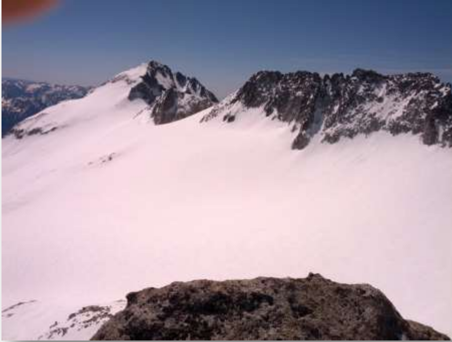
El Aneto, visto desde la cumbre de La Maladeta

Al llegar a la cumbre, el panorama es grandioso, disfrutando además de la soledad, al igual que en el Pico del Alba, ya que desde que salí del refugio hasta comenzar el descenso de La Maladeta no vi absolutamente a nadie. En la bajada del collado de la Rimaya, ya por fin me