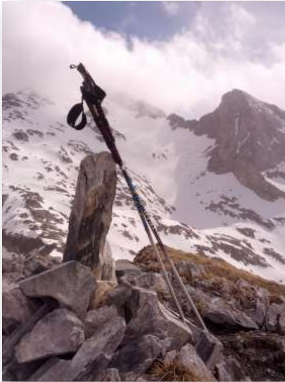
Cumbre del Pico de la Paderna

Los pasados 13, 14 y 15 de Mayo pasé tres días de esquí maravillosos en la zona de los Montes Malditos (Benasque), usando como base el refugio de La Renclusa. Realizando las excursiones que a continuación indico. Todo ello lo realicé en solitario.