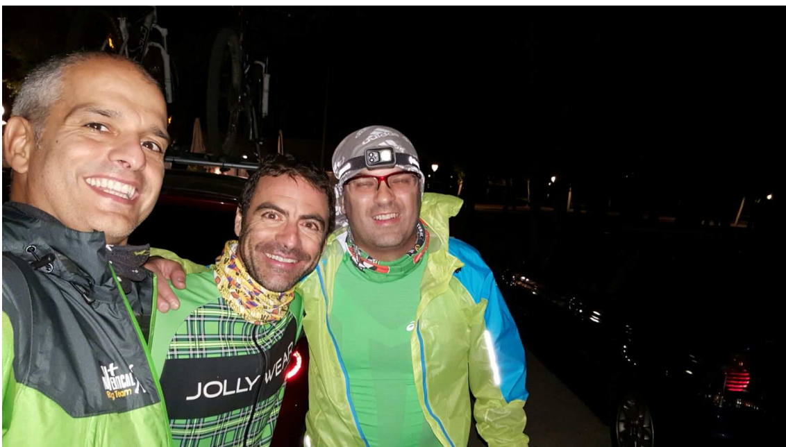
De nuevo en la Casa de Campo terminando nuestra aventura