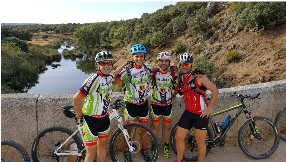
Puente de la Marmota