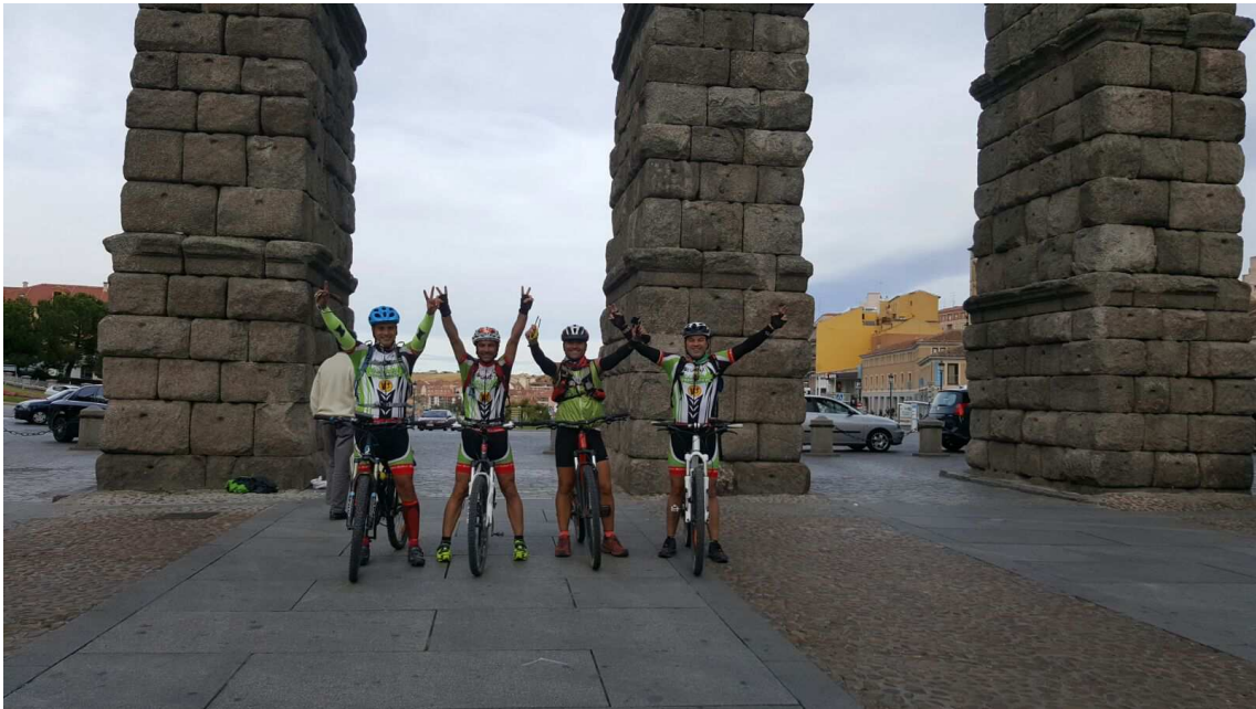
En el acueducto de Segovia