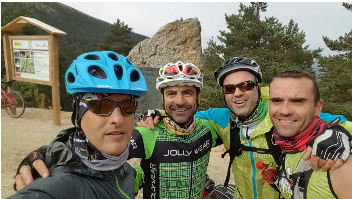
Alto del puerto de la Fuenfria