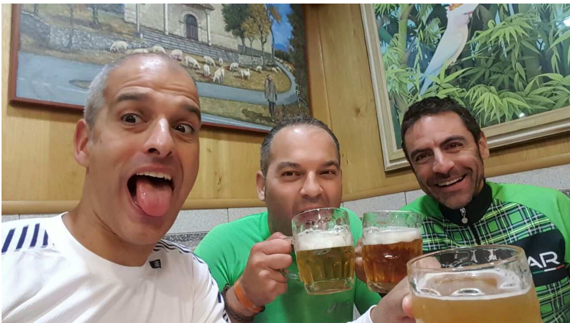
Cervecitas merecidas antes de coger el tren de vuelta a Madrid