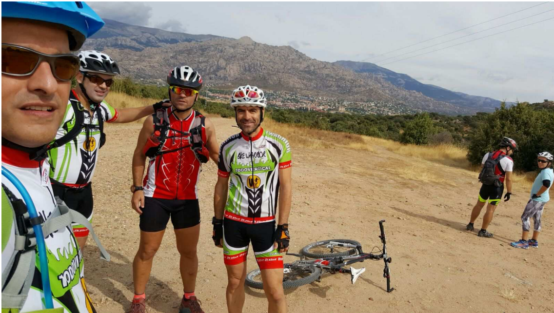
Llegando a Manzanares el Real