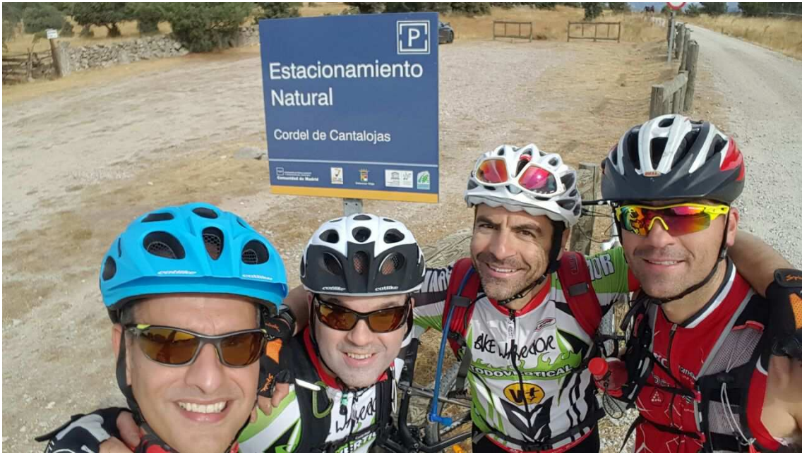
Por el Cordel de Cantalojas