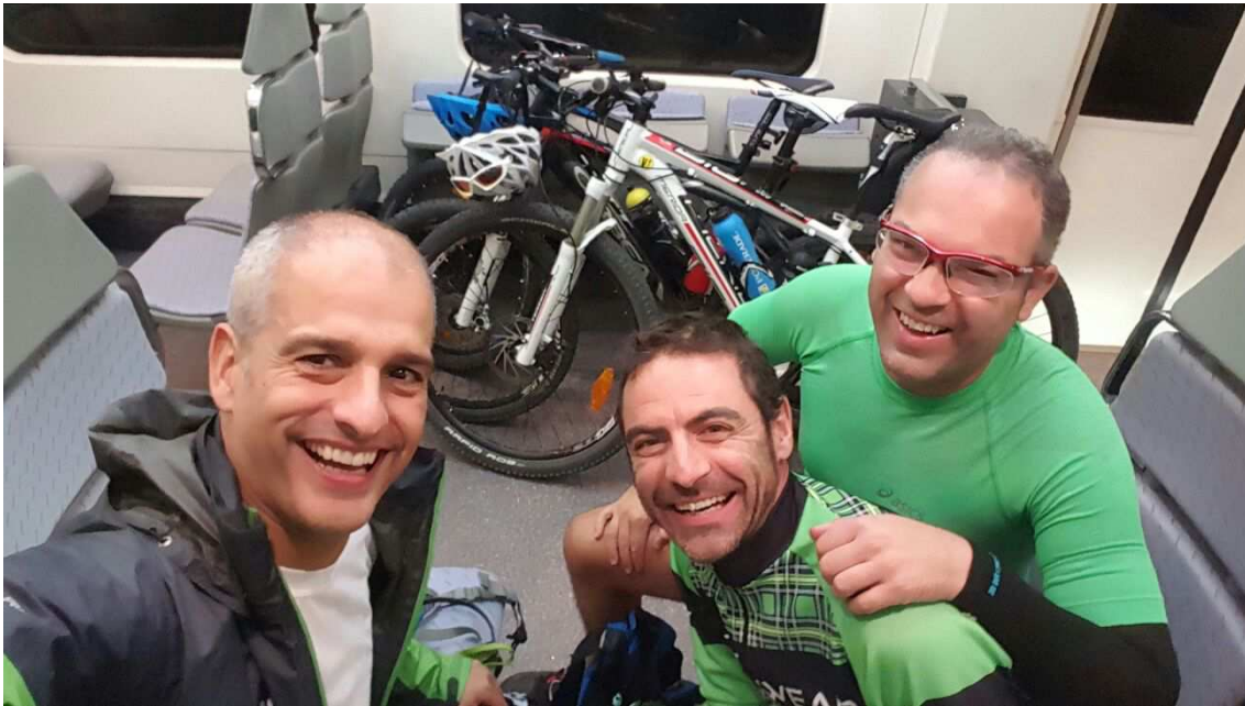
En el tren regresando a Madrid