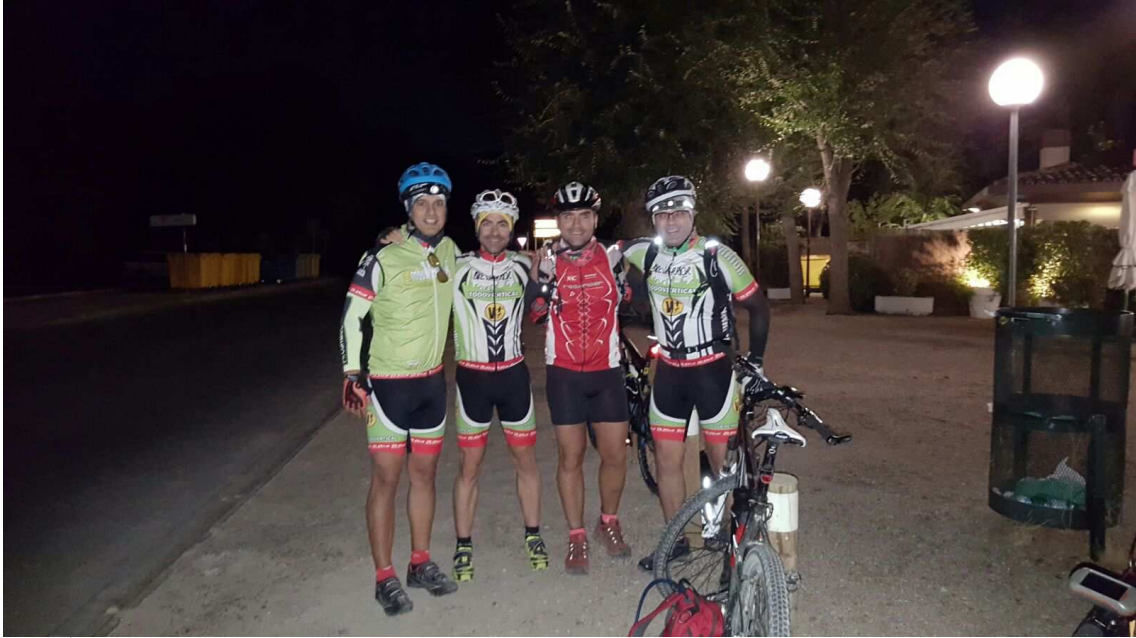
Saliendo en Casa de Campo