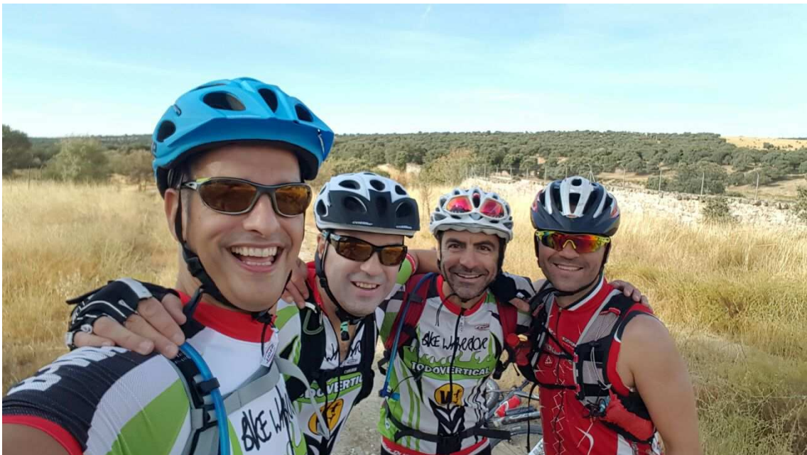
Por El Pardo