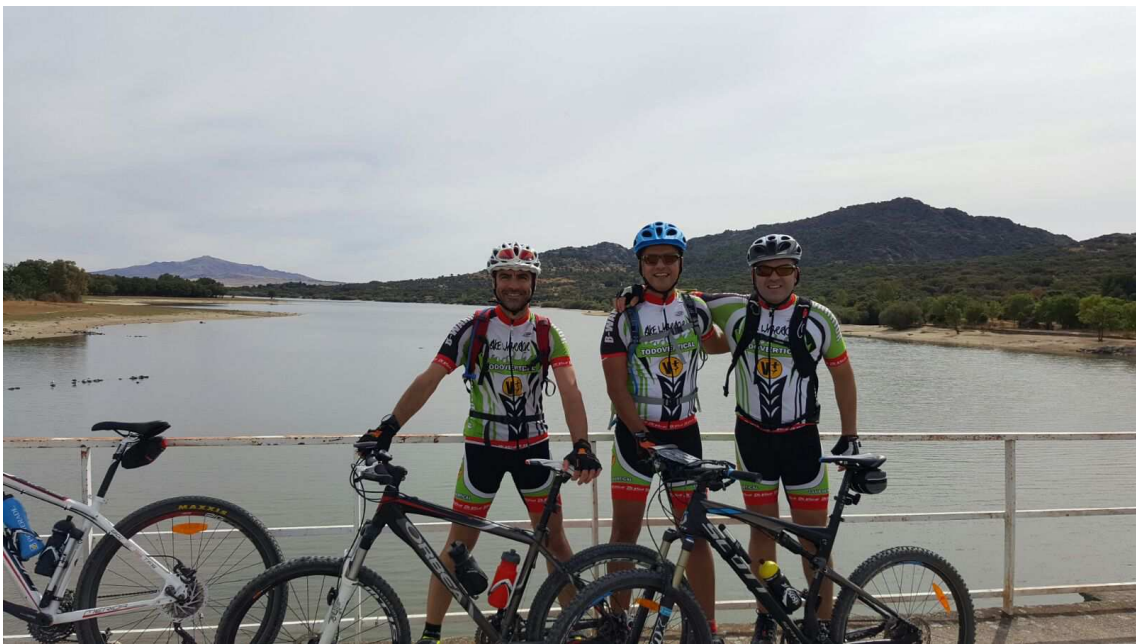
Embalse de Santillana