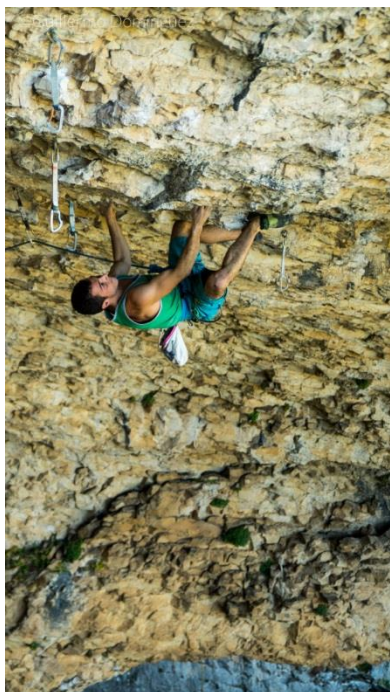
Sección clave de la Vía

Lo más duro de la vía es enlazar las dos secciones duras ya que no hay ningún reposo bueno entre ambas, y unido a la parte inicial de la vía, donde tampoco hay buenos reposos, hace que la resistencia sea el factor más limitante de la vía. Además, la sección más dura se soluciona con un método muy extraño que no a todos los escaladores les funciona. En mi caso, lo más difícil fue pasar la primera sección dura y poder ganar la resistencia. Después de 5 días de intentos, pude hacerme así con mi primer 8c+