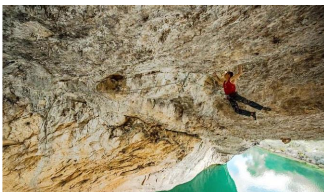
sección clave del primer largo (arriba) y sección final de la vía (abajo)