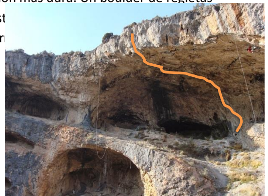
Imagen de la cueva de Alquezar, con la vía Tsunami marcada