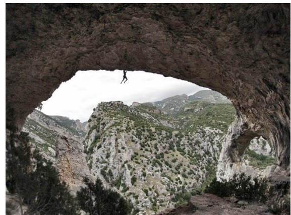
Imágenes: Javi Sánchez