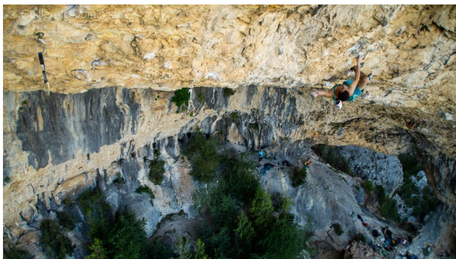
último paso duro de la vía