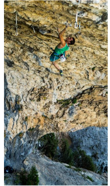
Tramo común de Mistral y Mistral Negra

Mistral negra es una variante de "mistral". Comparte el primer tramo de esta vía (que rondará el 8a+ o 8b) para unirse con la segunda parte de "Pata negra" 8c. Sin embargo, lo más duro de esta conexión es el tramo que existe para unir ambas vías. Este tramo apenas tiene dos cintas de extensión, pero para mí fue la sección más intensa de toda la vía. Tanto, que a pesar de tener una cotación inferior a "Mistral" y ya haber realizado ésta (con lo que conocía bien el primer tramo) invertí más intentos en la conexión que en la vía original. El motivo fue un error en el método utilizado realizando una sección muy física y aleatoria, para al final encontrar un método alternativo que me permití poder encadenar la vía, no sin antes caerme una vez en la parte de arriba de "Pata negra".