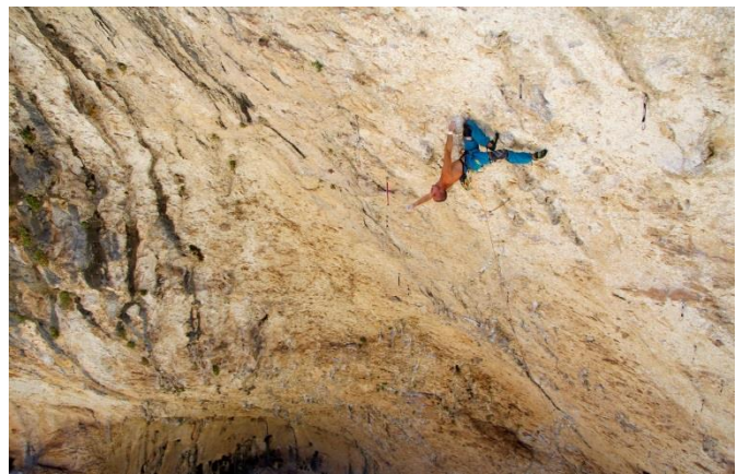
Cosi Fan Tutte, 8c+

Cosi Fan tutte es una vía situada en el Sector "La psicineta" en Rodellar. Un sector un poco inaccesible ya que solo se puede llegar o después de una hora andando o por medio de una barca remontando el río Alcanadre. La vía fue Equipada por Serge Casterán y cotada de 8c+ o 8c/8c+ y ha visto muchas repeticiones (relevante el encadene a vista de Magnus Midtboe) hasta que hace un par de años sufrió una rotura clave. Posteriores repetidores como Lucas Meignan sugirieron 9a o 8c+/9a, habiendose asentado al final en un sólido 8c+. La vía surca una plancha desplomada durante 50 metros, con un primer largo de 20 metros de 8a/8a+ para entrar justo a una sección dura de regletas y agarres pequeños. Tras varios metros más, viene un segundo crux con mejor canto pero más físico, para todavía tener que sufrir 18 metros más de resistencia sobre agare medio y una placa técnica final (en la cual llegué a caer una vez con la reunión a un metro). Esta vía me llevó unos 15 intentos y lo más difícil fue poder pasar el primer crux, ya que es una sección que necesita una buena condición, y en agosto las temperaturas no son las mejores. En mi opinión, esta vía no es solo la más dura sino también al más bonita que he podido escalar.