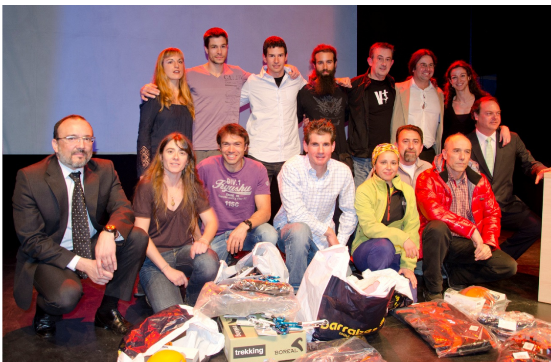
GALA BECAS CLUB TODOVERTICAL 2012