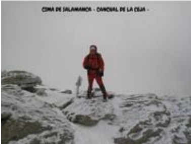
CIMA DE SALAMANCA - CAÑONAL DE LA CEJA -