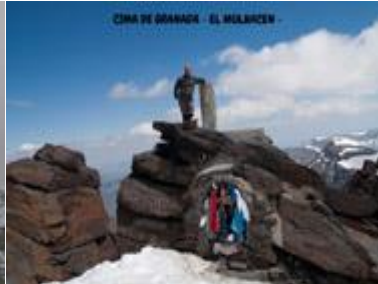
CIMA DE GRANADA - EL MULHACEN -