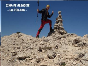
CIMA DE ALBACETE - LA ATALAYA -