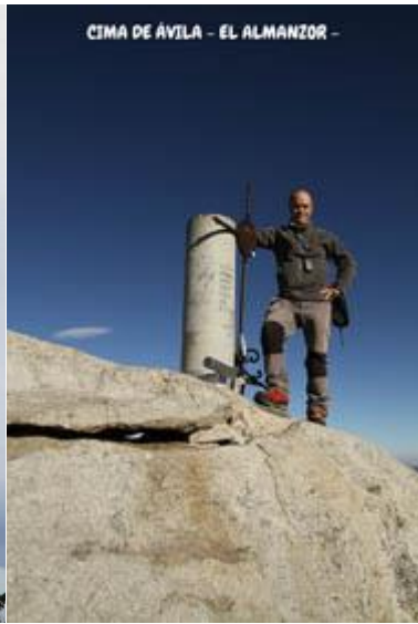
CIMA DE ÁVILA - EL ALMANZOR -