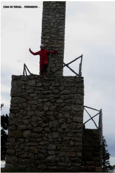
CIMA DE TERUEL - PEÑARROYA -