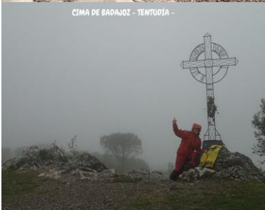
CIMA DE BADAJOZ - TENTUDIA -