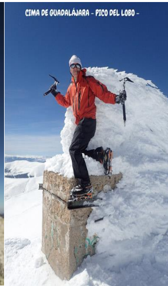
CIMA DE GUADALAJARA - PICO DEL LOBO -