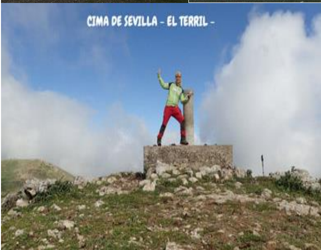
CIMA DE SEVILLA - EL TERRIL -