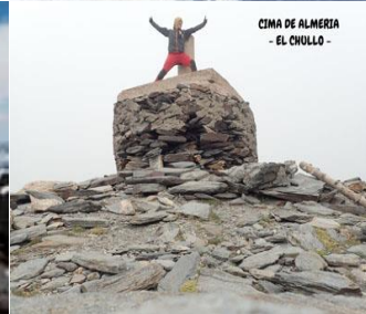
CIMA DE ALMERIA - EL CHULLO -