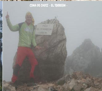
CIMA DE CADIZ - EL TORREÓN -