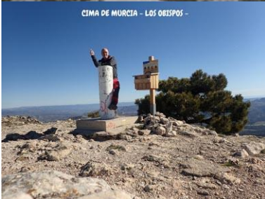
CIMA DE MURCIA - LOS OBISPOS -