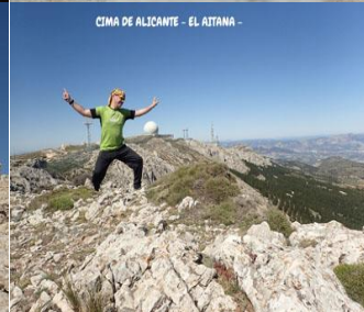
CIMA DE ALICANTE - EL AITANA -