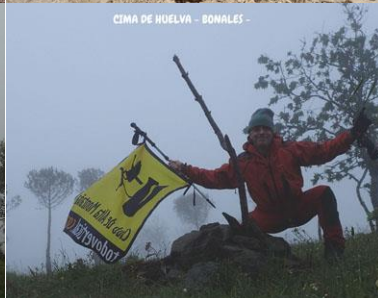
CIMA DE HUELVA - BONALES -