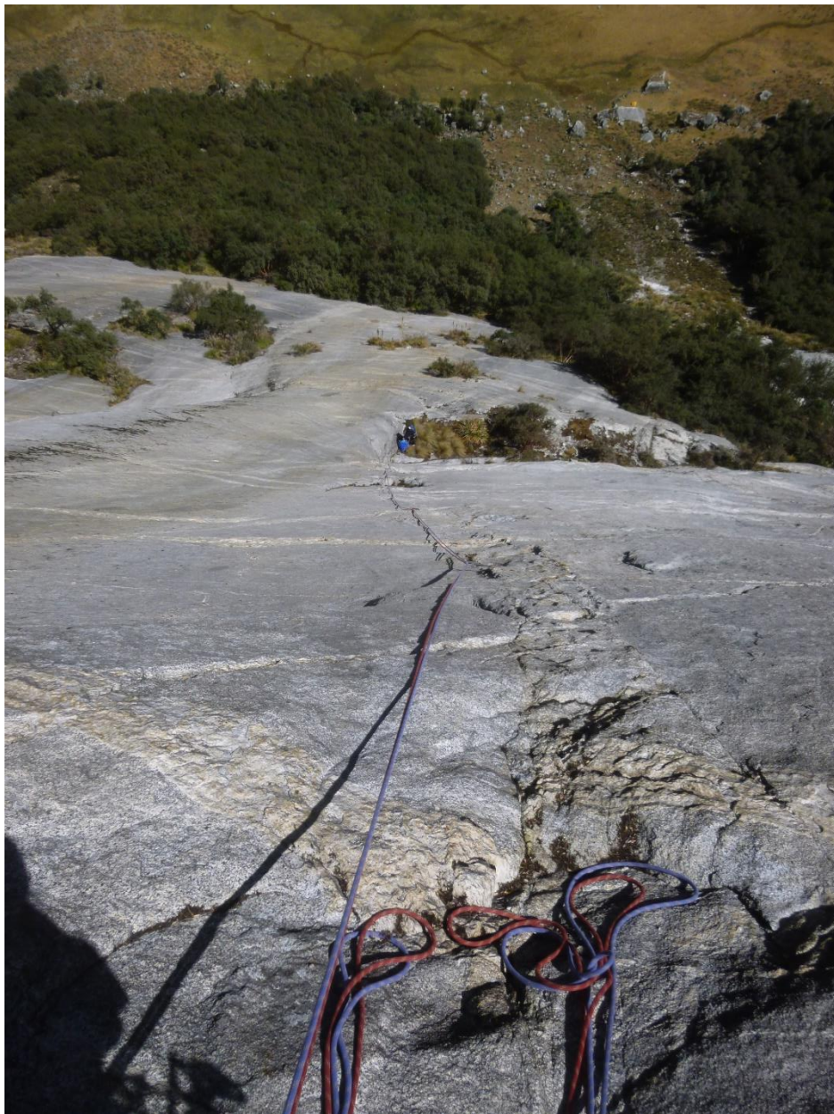
Largos de placas de adherencia