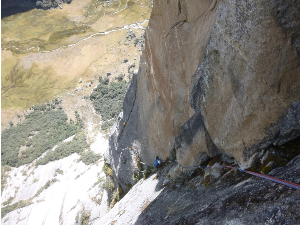
Largo 12 de fisura excepcional pero muy sucio