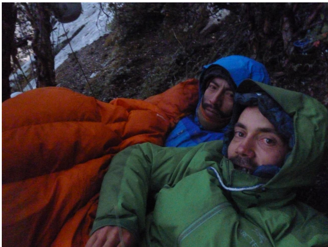
Segundo vivac tras haber rapelado la primera parte de la vía