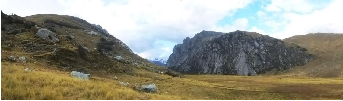
Aproximación a las torres de Rurec