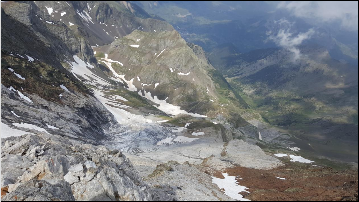
Vistas desde la Marmolera.