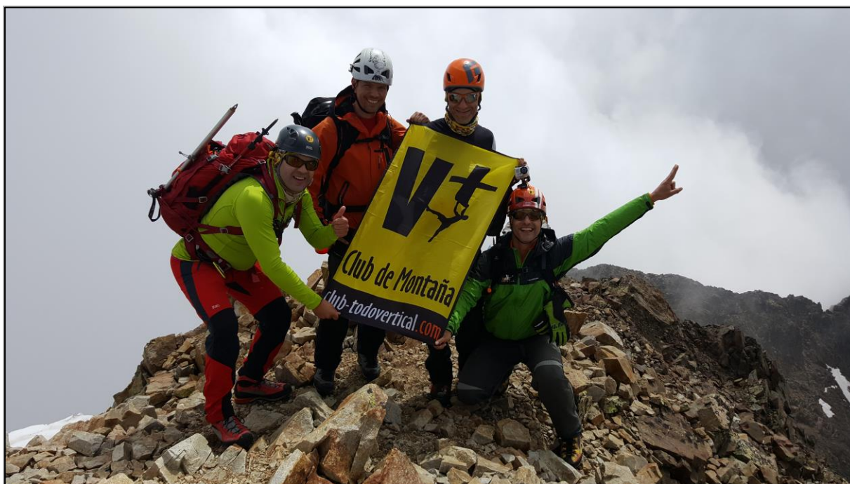
Cima en el Pico Central.