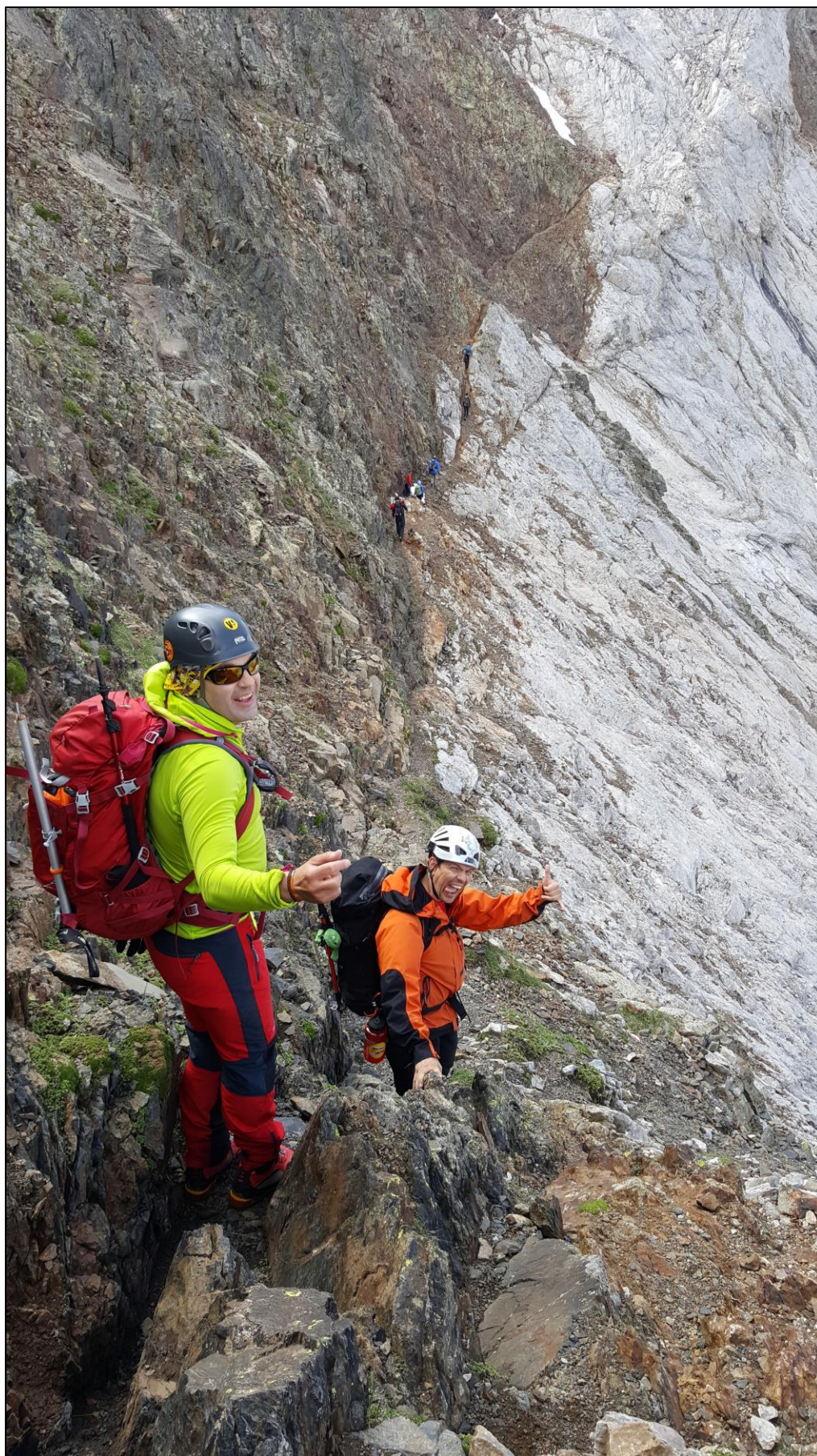
Ascendiendo a la cresta.