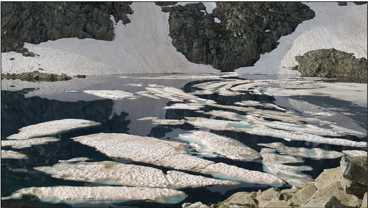
Ibon azul superior.