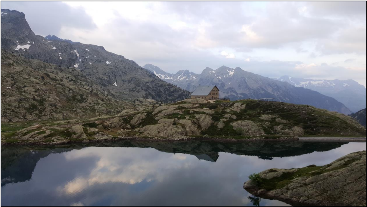
Refugio de Bachimaña con el Ibon de Bachimaña.