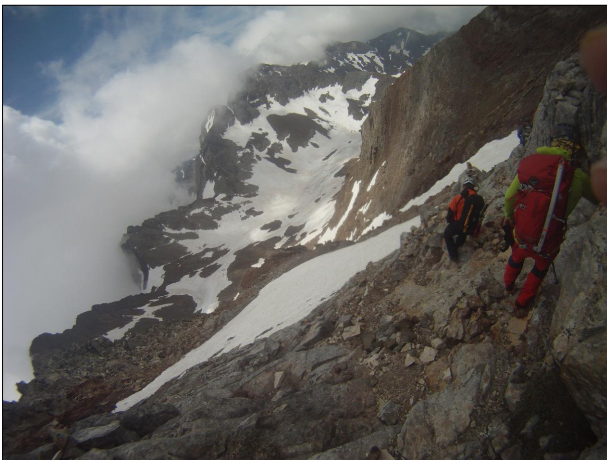
Bajada al Collado de Saretas.