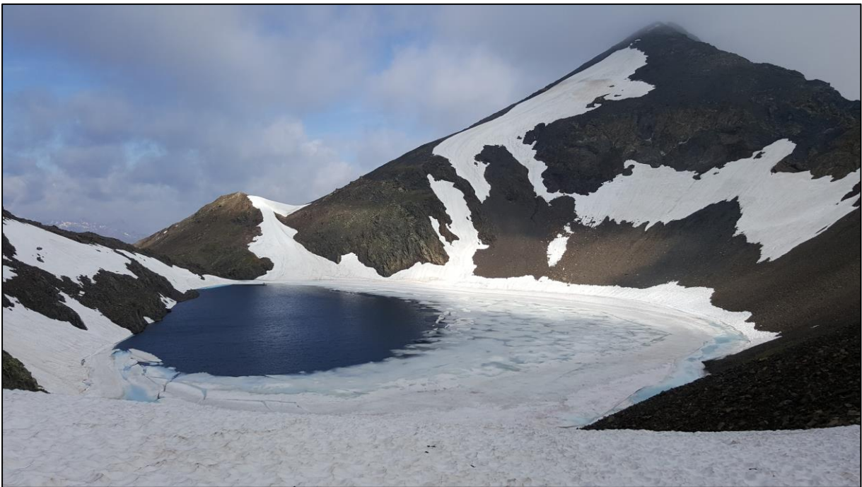
Pico e Ibon de Tebarray.