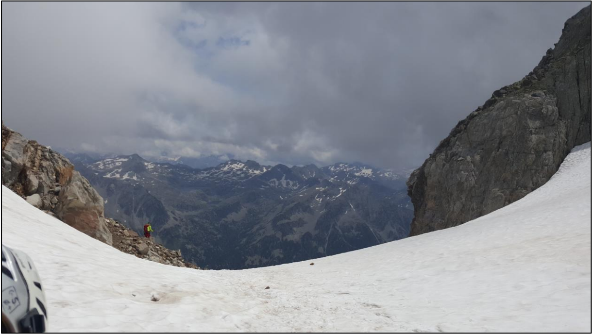
Condado de Pondiellos.