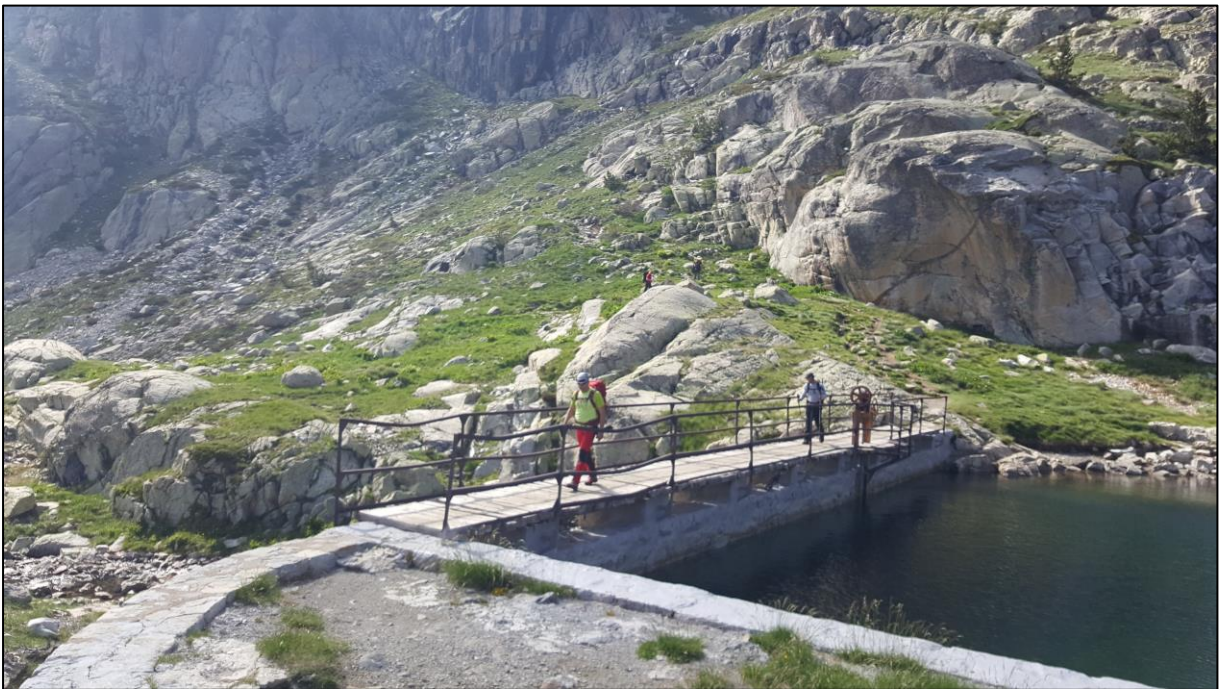
Regreso al refugio Bachimaña.