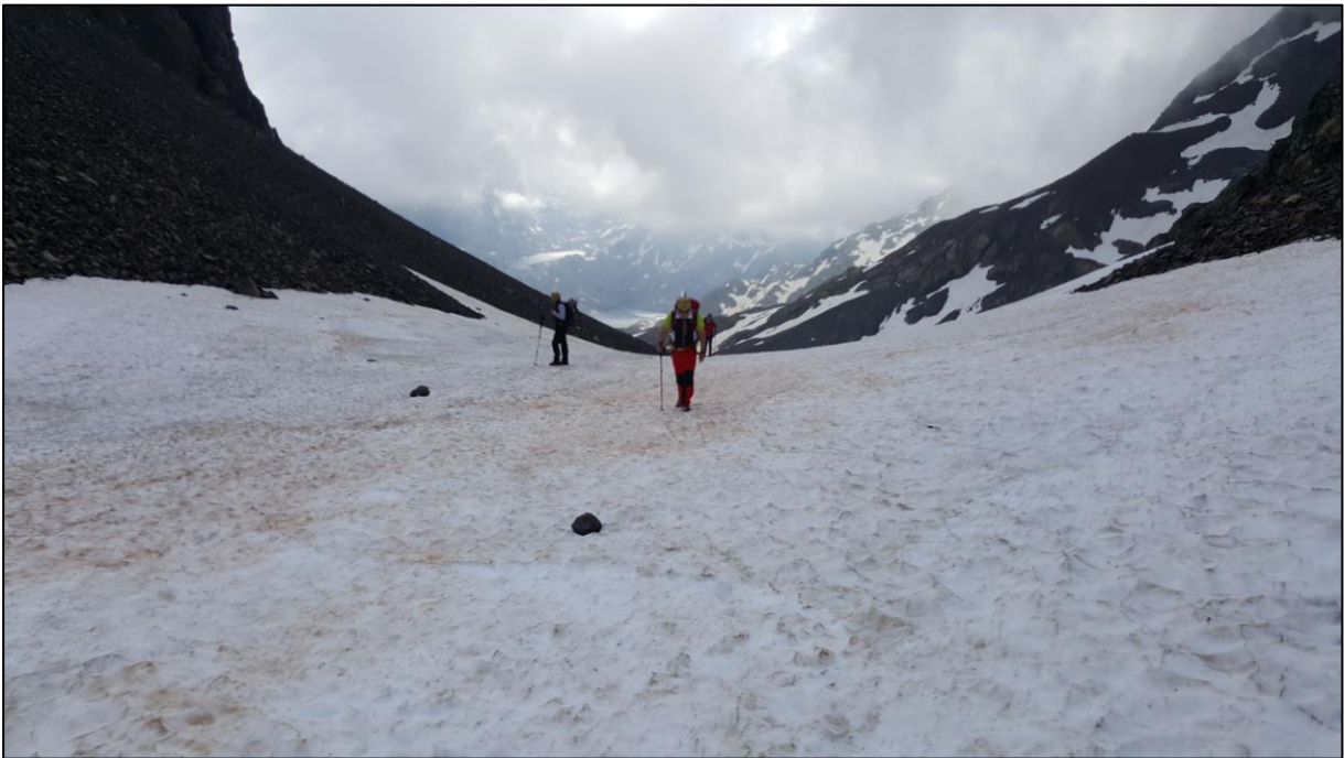
Collado de los Infiernos.