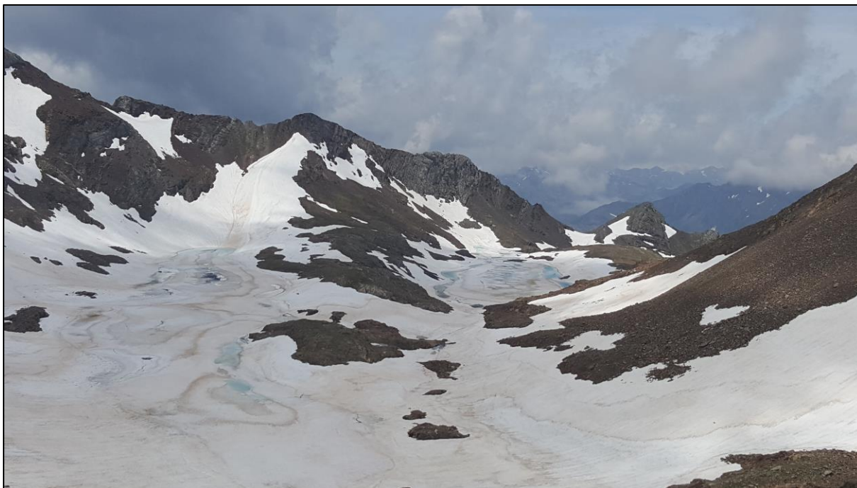
Ibones de Pondiellos.