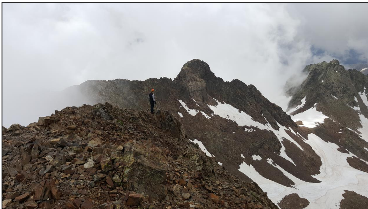
Vistas desde el último Pico al pico Arnales y Pico de Pondiellos.