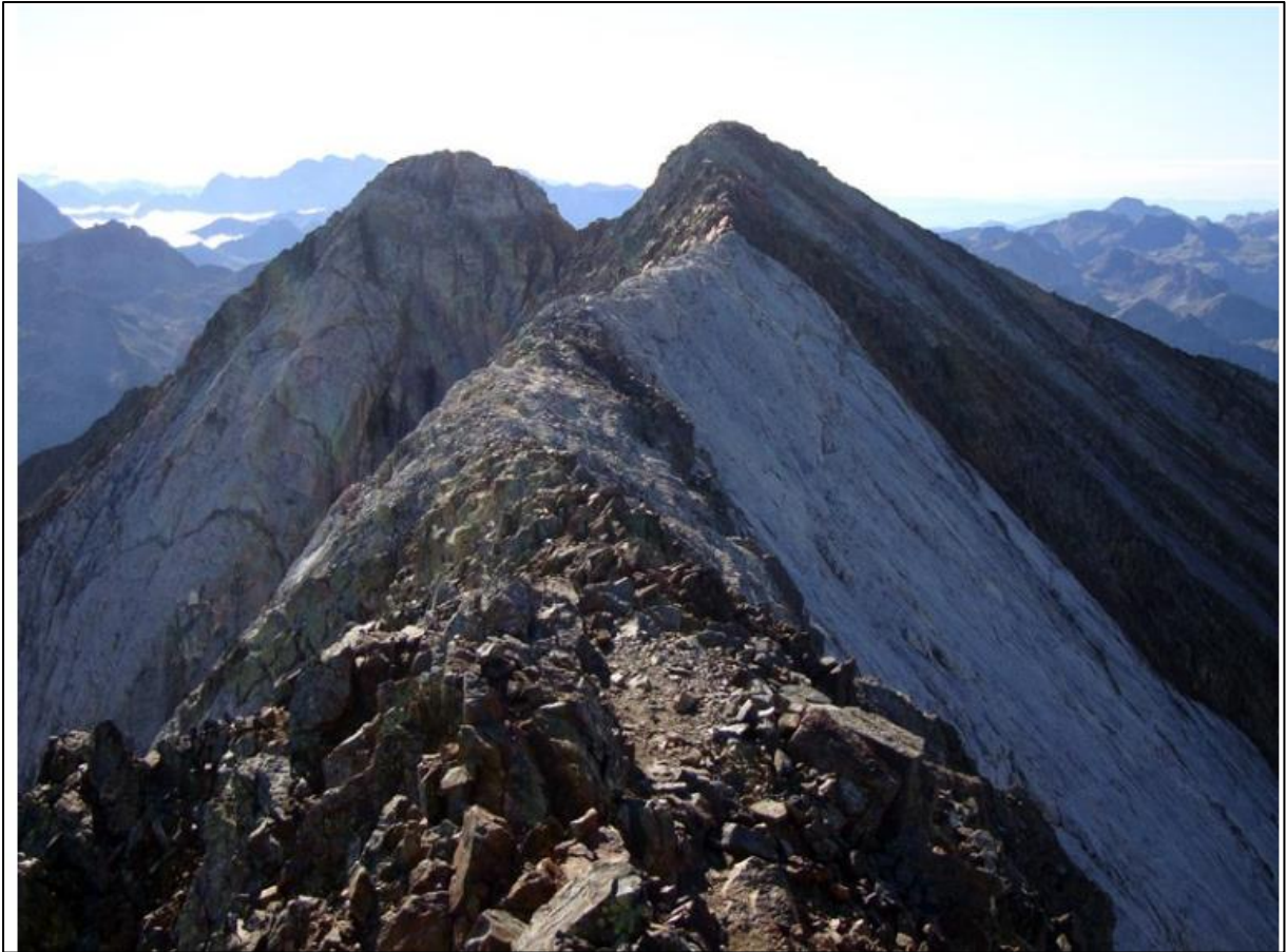
Cresta de los Picos del Infierno con la Marmolera en la parte central.