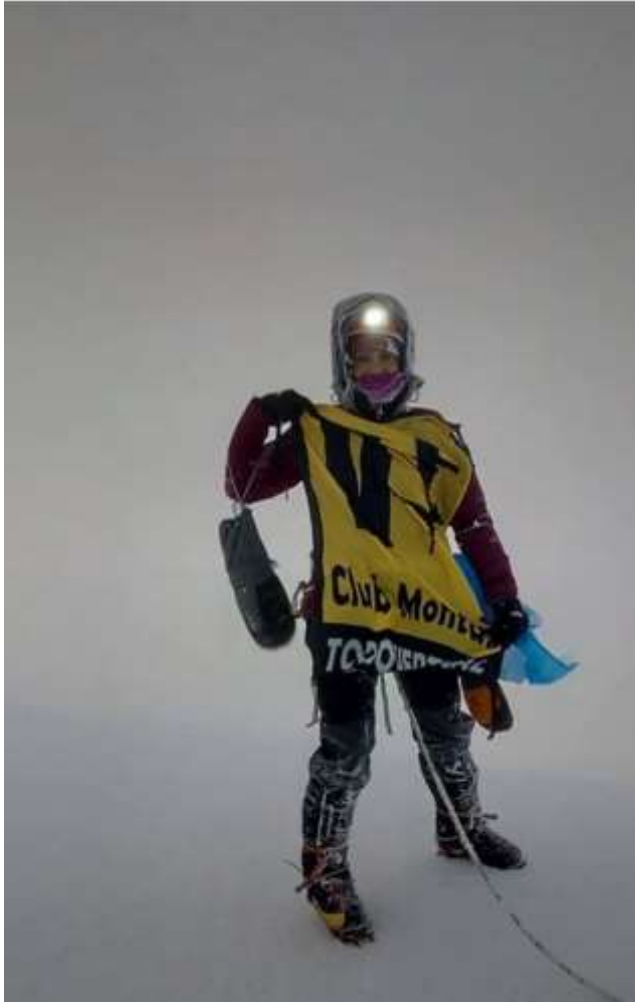
En la Cima de Europa acompañada de la bandera de mi país y de mi club de montañismo