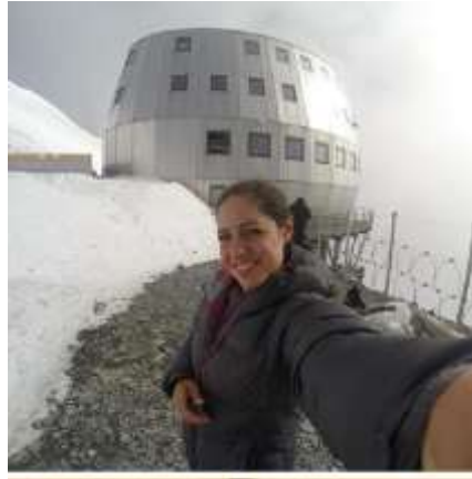
Refugio de Gouter.