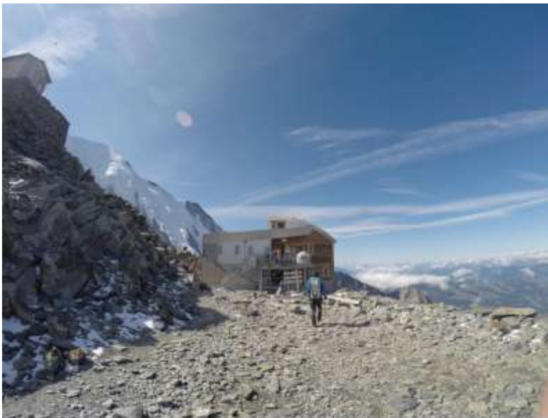
Refugio de Tete Rouse